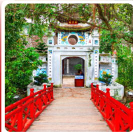
วัดหงอกเซิน