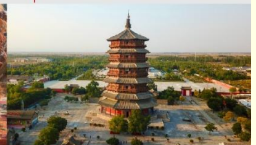
วัดเจดีย์ไม้ มู่ต้า

*ทางบริษัทฯ ขอสงวนสิทธิ์ในการสลับโปรแกรมทัวร์ตามความเหมาะสมขึ้นอยู่กับสถานการณ์หน้างาน โดยคำนึงถึงผลประโยชน์ของลูกค้าเป็นสำคัญ