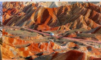
ภูเขาสายรุ้งจางเย่ต้นเสี่ย