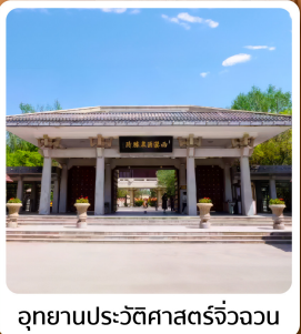
อุทยานประวัติศาสตร์จิวจวน

ไฮไลท์! เขตท่องเที่ยวเกี่ยวเกี่ยวจิงจางหม่า ชมทุ่งหญ้าและภูเขาสวยแห่งกานซู ภูเขาสายรุ้งจางเย่ต้นเสี่ย "มหัศจรรย์ภูเขาสายรุ้งหลากสี"