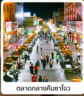
ตลาดกลางคืนซาโจว

อาหารมื้อพิเศษ ไก่ตุ๋นหม้อโอ่งน้ำ ซีโครงหมูสัโถล็กานโจว