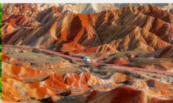
ภูเขาสายรุ้งจางเย่ต้นเสี่ย