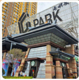
ห้าง G Park