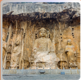
กำแพงเหลืองหิน