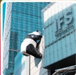
แพนด้ายักษ์บนตึก IFS

● ไอล็อก อุทยานแห่งชาติป่าผิงโกว สวิตเซอร์แลนด์น้อยแห่งเสฉวนตะวันตก Chengdu SKP จุดถ่ายรูปรูปยอดเยี่ยมและทำคอนเทนต์ของวัยรุ่นเจิงตู