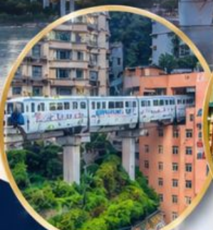
รถไฟทะลุตึก Liziba Station