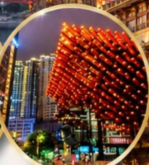
หอศิลป์กั๋วไท่ Guotai Arts Center