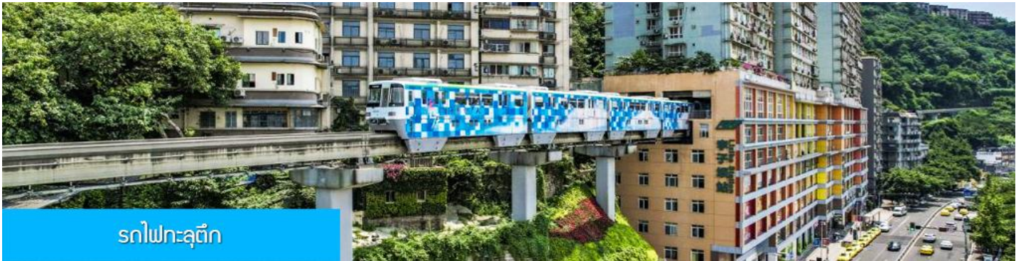
รถไฟทะเลวูตีก

พักที่ HOLIDAY INN EXPRESS HOTEL โรงแรมระดับ 4 ดาวหรือเทียบเท่า เมืองจงชิ่ง