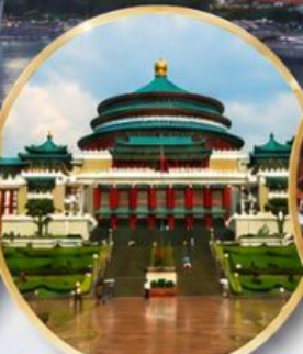
มหาศาลาประชาชน Great Hall of the People