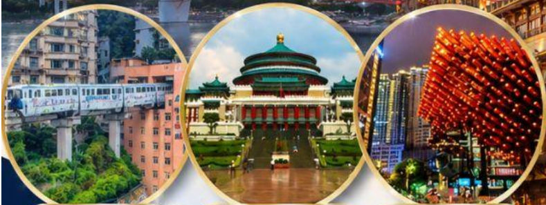
รถไฟทะลุตึก Liziba Station