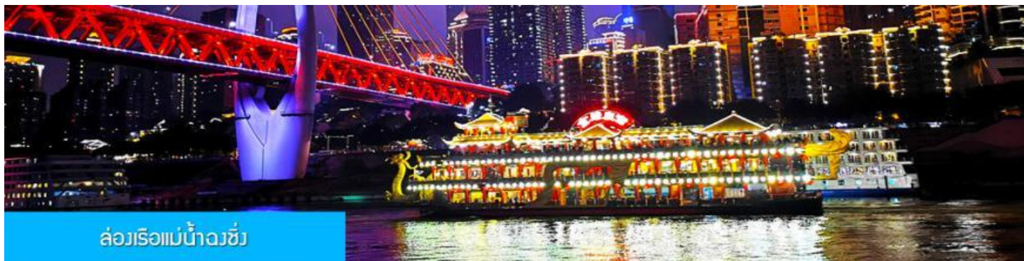
ล่องเรือแม่น้ำฉงชิ่ง