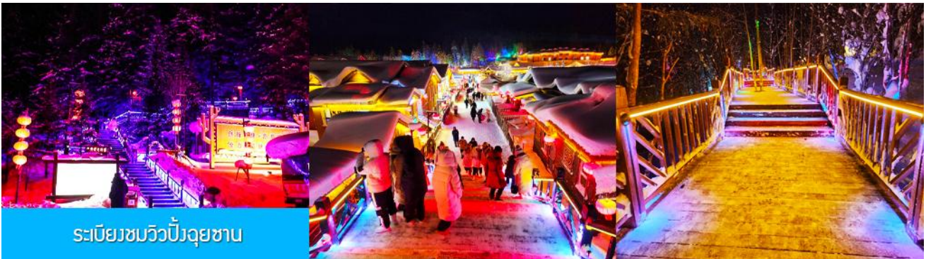
ระเบียงชมวิวยิ่งจฺยชาน