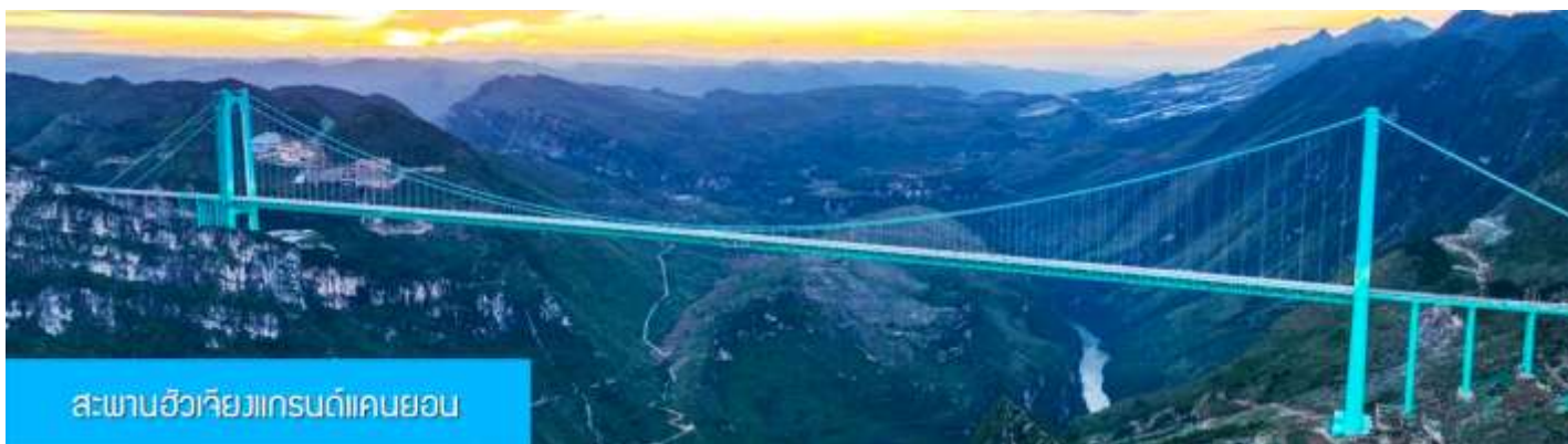
สะพานฮัวเจียงแกรนด์แคนยอน

พักที่ WINDHAM HOTEL โรงแรมระดับ 4 ดาวท้องถิ่นในเมืองอันชุ่น