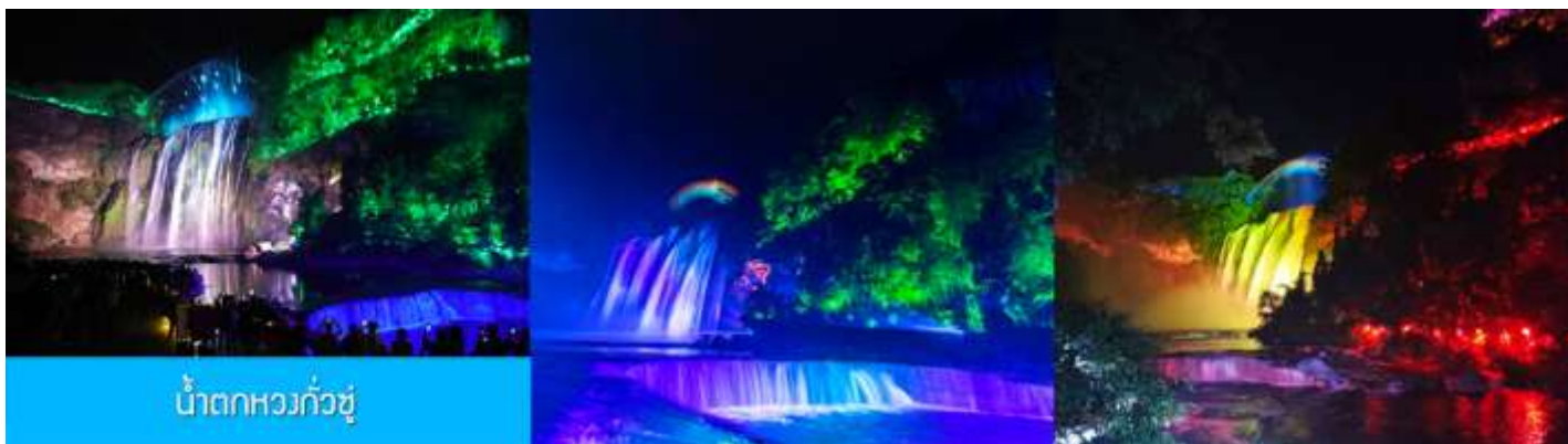
น้ำตกหวงกั๋วชู่

หลังอาหารนำท่านเที่ยวชม น้ำตกหวงกั๋วชู่ 黄果树瀑布 แหล่งท่องเที่ยวขึ้นชื่อระดับ 5A ที่ถือเป็นสัญลักษณ์ของมณฑลกุ้ยโจว เป็นหมู่ น้ำตกที่ประกอบด้วยน้ำตกน้อยใหญ่กว่าสิบแห่ง โดยมีน้ำตกหวงกั๋วชู่เป็นน้ำตกขนาดใหญ่ที่มีความสูง 74 เมตร กว้าง 81 เมตร เป็นน้ำตกหลักของอุทยาน ชมความสวยงามของน้ำตกที่ประดับด้วยแสงสีและเลเซอร์ยามค่ำคืน ที่แต่งแต้มความมหัศจรรย์แก่อุทยานแห่งนี้ (ค่าทัวร์รวมค่ารถรับส่ง รวมค่าบันไดเลื่อนขาลง และขาขึ้นภายในอุทยาน)