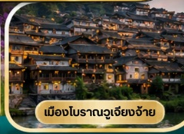
เมืองโบราณฉูเจียงจ้าย