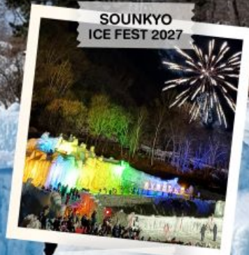
SOUNKYO ICE FEST 2027