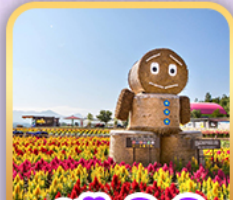
สวนซิกิโซโนะโอกะ