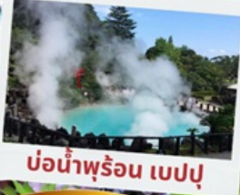
บ่อน้ำพุร้อน เปรปุ

หมู่บ้านยูฟูอินฟลอร์ริล ทะเลสาบคินริน ทะเลสาปคินริน บ่อน้ำพุร้อน อุมิจิโกกุ ท่าเรือโมจิโกะ เรโร ตลาดปลาคาราโตะ ศาลเจ้ามียาจิดาเกะ ดิวตี้ฟรี ฟุกุโอกะ เบย์ พลาซ่า ช้อปปิ้งออน มอลล์ สินคู้เมโอโตะอิวะ ชมดอกไม้ไฮเดรนเยย รอบน้ำตกชิราอิโตะ ช้อปปิ้งย่านเท็นจิน