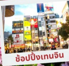
ช้อปปิ้งเทนจิน