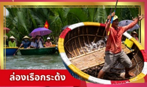
ล่องเรือกระตัง