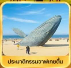
ประมาติกรรมวาฬเกยตื้น