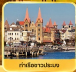
ท่าเรือชาวประมง