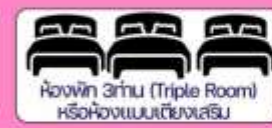
ห้องพัก 3 ท่าน (Triple Room) หรือห้องแบบเตียงเสริม

กรณีพัก 3 ท่านถ้าวันที่เข้าพักโรงแรม ไม่มีห้อง TRP (3 ท่าน) อาจจำเป็นต้องแยกพัก 2 ห้อง (มีค่าใช้จ่ายพักเดี่ยวเพิ่ม) กรณีห้อง TWIN BED (เตียงเดี่ยว 2 เตียง) ซึ่งโรงแรมไม่มีหรือเต็ม ทางบริษัทขอปรับเป็นห้อง DOUBLE BED แทนโดยมีต้องแจ้งให้ทราบล่วงหน้า หรือหากต้องการห้องพักแบบ DOUBLE BED (1 เตียงใหญ่) ซึ่งโรงแรมไม่มีหรือเต็ม ทางบริษัทขอปรับเป็นห้อง TWIN BED แทนโดยมีต้องแจ้งให้ทราบล่วงหน้า กรณีห้องพักในเมืองที่ระบุไว้ในโปรแกรมมีเทศกาลวันหยุดยาว มีงานประชุมหรืองานแฟร์ต่างๆ บริษัทขอจัดที่พักในเมืองใกล้เคียงแทน