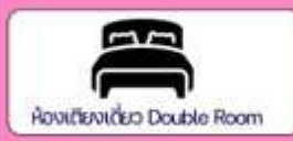
ห้องเตียงเดี่ยว Double Room