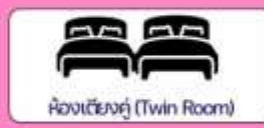
ห้องเตียงคู่ (Twin Room)