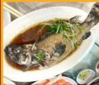
ปลาหนังซีอิ๊ว