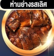
ห่านย่างสไลส