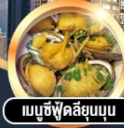
เมนูซีฟู้ดพรีเมียม