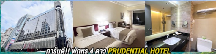
การ์ตูนดี!! พักหรู 4 ดาว PRUDENTIAL HOTEL ติดถนนนาธาน ย่านช้อปปิ้งจิมซาจуй