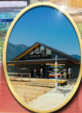
Ao Lakeside Cafe