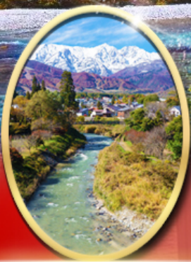
โออิดะพาร์ค