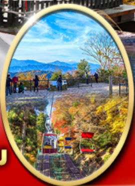
ภูเขา ทาคาโอะ

รหัสทัวร์ RJ-XJ127 เดินทาง 6D 4N กันยายน - พฤศจิกายน 69