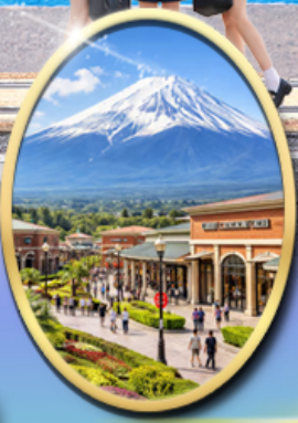
Gotemba Premium Outlets

รหัสทัวร์ RJ-XJ133 เดินทาง 5D 3N กันยายน 2569