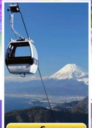
อิซุฟานรามาวิว