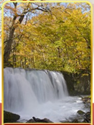
ลำธารโออิราสะ