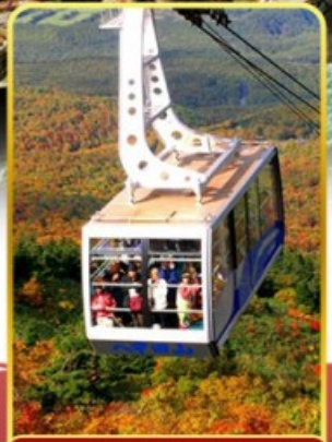
นั่งกระเช้าอากิโกะ