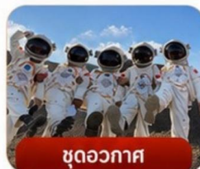
ชุดอวกาศ