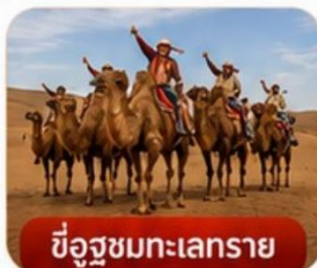
ขี้อูฐทะเลทราย