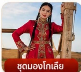
ชุดมองโกเลีย