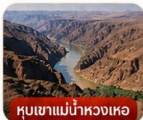
หุบเขาแม่น้ำหงเหอ