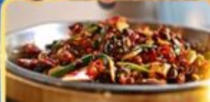
อาหารเสฉวน