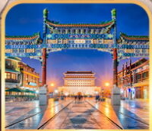
ถนนเทียนเหมิน