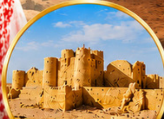
กลุ่มปราสาททะเลทราย (Desert Castles)