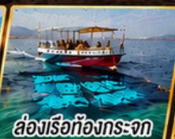
ล่องเรือท้องกระจก