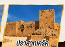
ปราสาทเคร์ค