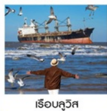
เรือบลูวิส