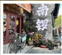
ถนนโบราณหนานหลิวกู่เซียง