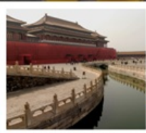
พระราชวังกู่กง