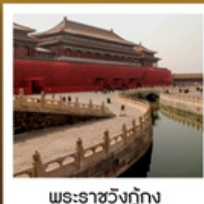
พระราชวังกรุงปักกิ่ง