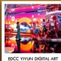
EDCC YIYUN DIGITAL ART