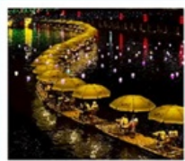
ล่องเรือมังกรแม่น้ำก้งสุ่ย