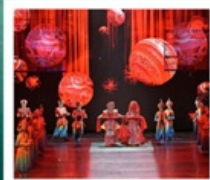
โชว์ซีหลานซาฝู่