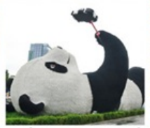
รูปปั้นหมีแพนด้าซลมี