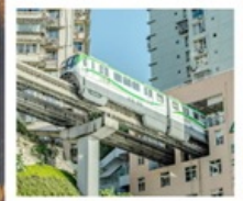
รถไฟฟ้าทะลุคด