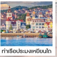
ท่าเรือประมงเหยียนโก๋

เรือลิวส์ / ย่านฮั่นเล่อฟาง / ถนนฮั่วจวิปา ท่าเรือประมงเหยียนโก๋ / ย่านองโขว่ 1920 / ถนนโบราณเฉาหยาง หอคอยกาลเวลา / ชายหาดจินซา / รูปปั้นปลาวาฬ / หาดทรายซาจื่อโหว่ หาดไซเบอร์ NO.3 / โรงงานเบียร์ชิงเต่า / โบสถ์ St. Emil ถนนคนเดินไต้ตง / สะพานจันเฉียว / จัตุรัส 54 / ห้าง MIXC