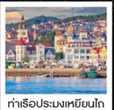
ท่าเรือประมงเหยียนโกะ