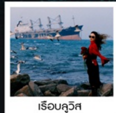
เรือบลูวิส

หอคอยกาลเวลา / รูปปั้นปลาวาฬ / ถนนโบราณเตาหยาง / ย่านสงโขว่ 1920 / เมืองเว่ยไห่ / ถนนฮั่วจวีป่า / จตุรัสประตูแห่งความสุข ย่านอันลอฟ่าง / เรือบลูวิส / หาดซาจื่อฮั่ว / ถนนหลงเจียง / สะพานจันเจียว / หาดไซเบอร์ No. 3 ถนนจงซาน / โบสถ์ St.Emill / จตุรัส 54 / ศูนย์เรือใบโอลิมปิก / พิพิธภัณฑ์เบียร์ชิงเต่า / ถนนไท่ตง / ท่าเรือประมงเหยียนโกะ