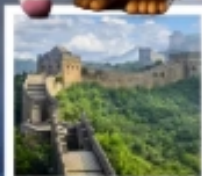
กำแพงเมืองจีนด่านซือหม่าโต

เมืองโบราณกู่เป่ย์ซู่เจิน / กำแพงเมืองจีนด่านซือหม่าโต (รวมค่ากระเช้าขึ้น-ลง) / ชมวิวกำแพงเมืองจีนและเมืองโบราณ ยูนิเวอร์แซลปักกิ่ง (รวมค่าบัตรเข้า) / จตุรัสเทียนอันเหมิน / พระราชวังโบราณฤดูร้อน / หอบูชาเทียนถาน คาเฟ่กาแฟบ้านน้ำตาด (TANG FANG CAFE) / พระราชวังฤดูร้อนอวิ๋เหอหยวน / ย่านชานหลี่ถุน (POP MART) / ถนนคนเดินไท่กู่หลี่