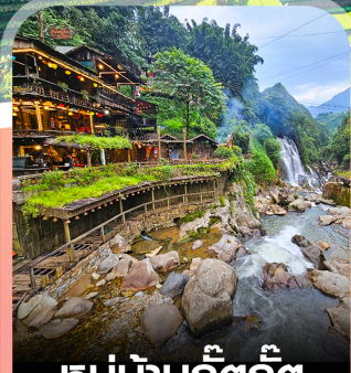
หมู่บ้านก๊ต๊ก๊ต