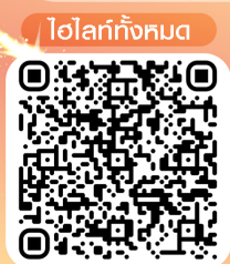
ไฮโลที่ทั้งหมด