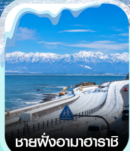
เขายั้งอามาฮาราชิ