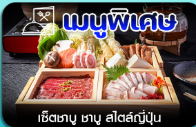
เชิเตาซู ซามู สีสต์ญี่ปุ่น