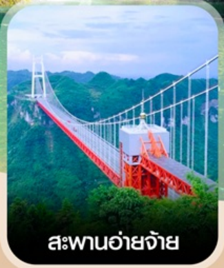
สะพานอ้ายจ้าย