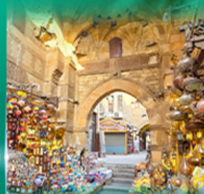
ตลาดข่านเอลคาลิลี