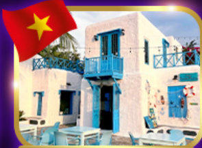
คาเฟ่สุดชิค ซานทรา มารีน่า