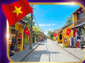
เมืองท่ามรดกโลก ฮอยอัน