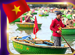
เรือกระด้ง หมู่บ้านกัมทาน