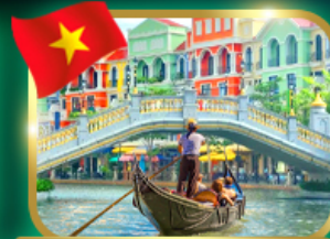
เวนิสจำลอง แกรนด์ เวลด์