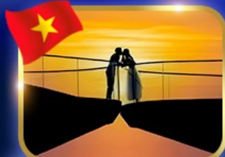
เช็คนินสุดหวาน สะพานรูป