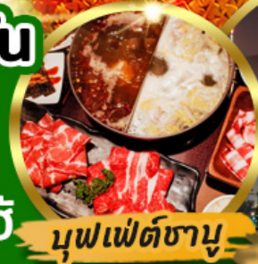
บุฟเฟต์ชาบู