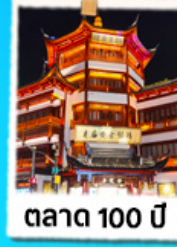
ตลาด 100 ปี