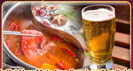
*Buffet New Mala free flow beer & soft drink