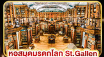
หอสมุดนครคิกไออัน St.Gallen