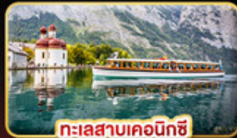
ทะเลสาบเคอนิกซี