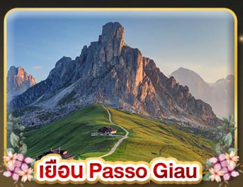
เขื่อน Passo Giau