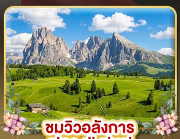
ชมวิวดังการ alpe di siusi