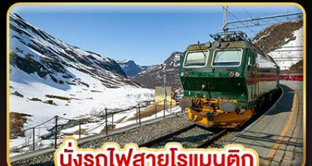
นั่งรถไฟสายโรแมนติก “พร้อมสปา”