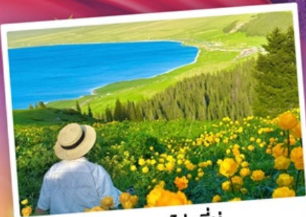
ทะเลสาบโซห์ลีมู่

ถ่ายรูปทุ่งดอกลาเวนเดอร์ - กุ้งหญ้าคาลาจัน ★ SKY GRASSLAND กุ้งหญ้าบรมกโลก