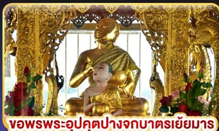
ขอพรพระอุปคุตปางจากบาตรเขี่ยมาร