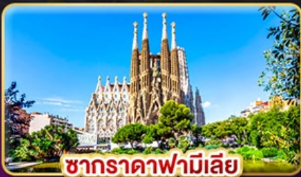
ซากradaฟามีเลีย

สัมผัสเสน่ห์ลาเวนเดอร์ "โปรวองซ์" แห่งฝรั่งเศสใต้