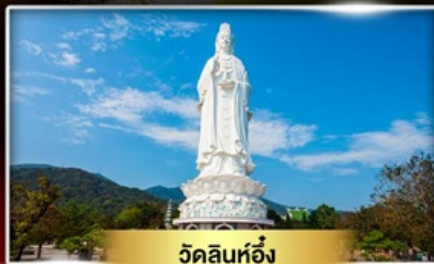
วัดลินห์อิ่ง